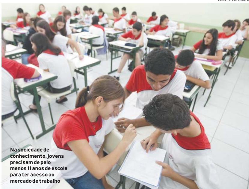
Na sociedade de conhecimento, jovens precisam de pelo menos 11 anos de escola para ter acesso ao mercado de trabalho